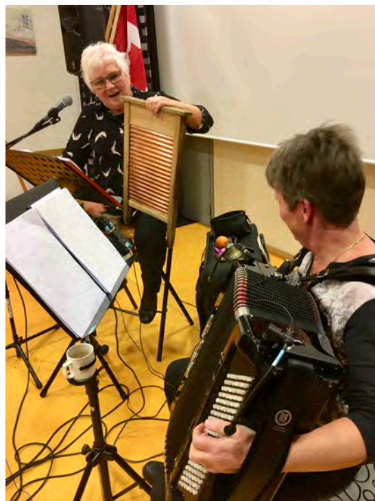
Duo Mix fikk oss i julestemning!