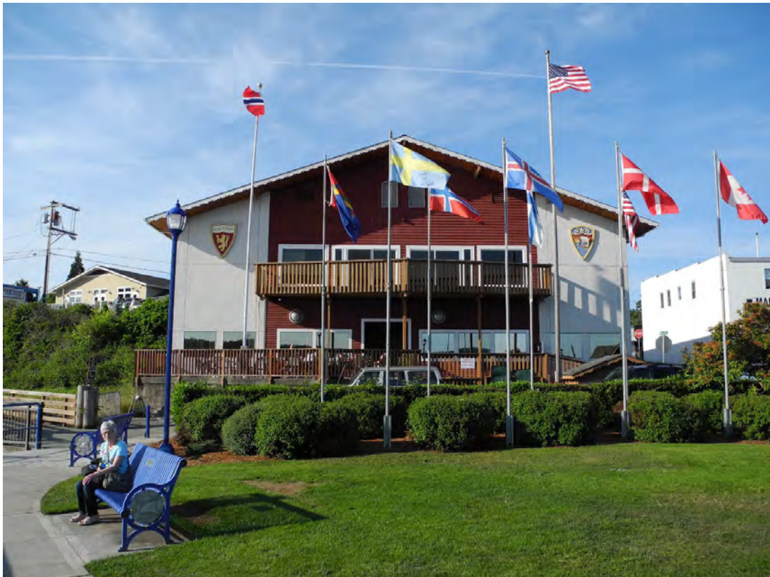
Lokalene til SofN Poulsbo Lodge 2-044 i Poulsbo, Washington

(Vi kommer sikkert til å vise noen bilder fra turen på et medlemsmøte.)