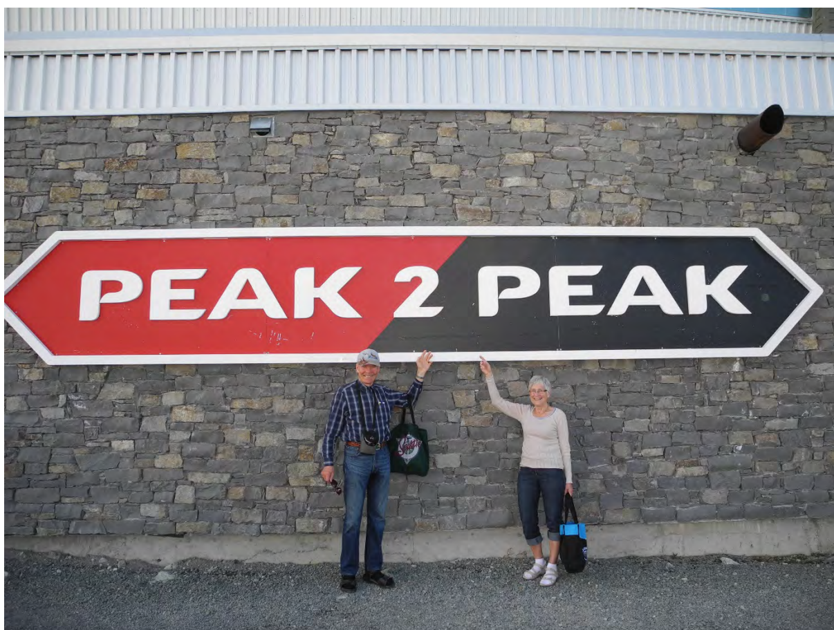
Her er vi i Whistler, OL-byen 2010, og er på toppen av gondolbanen.