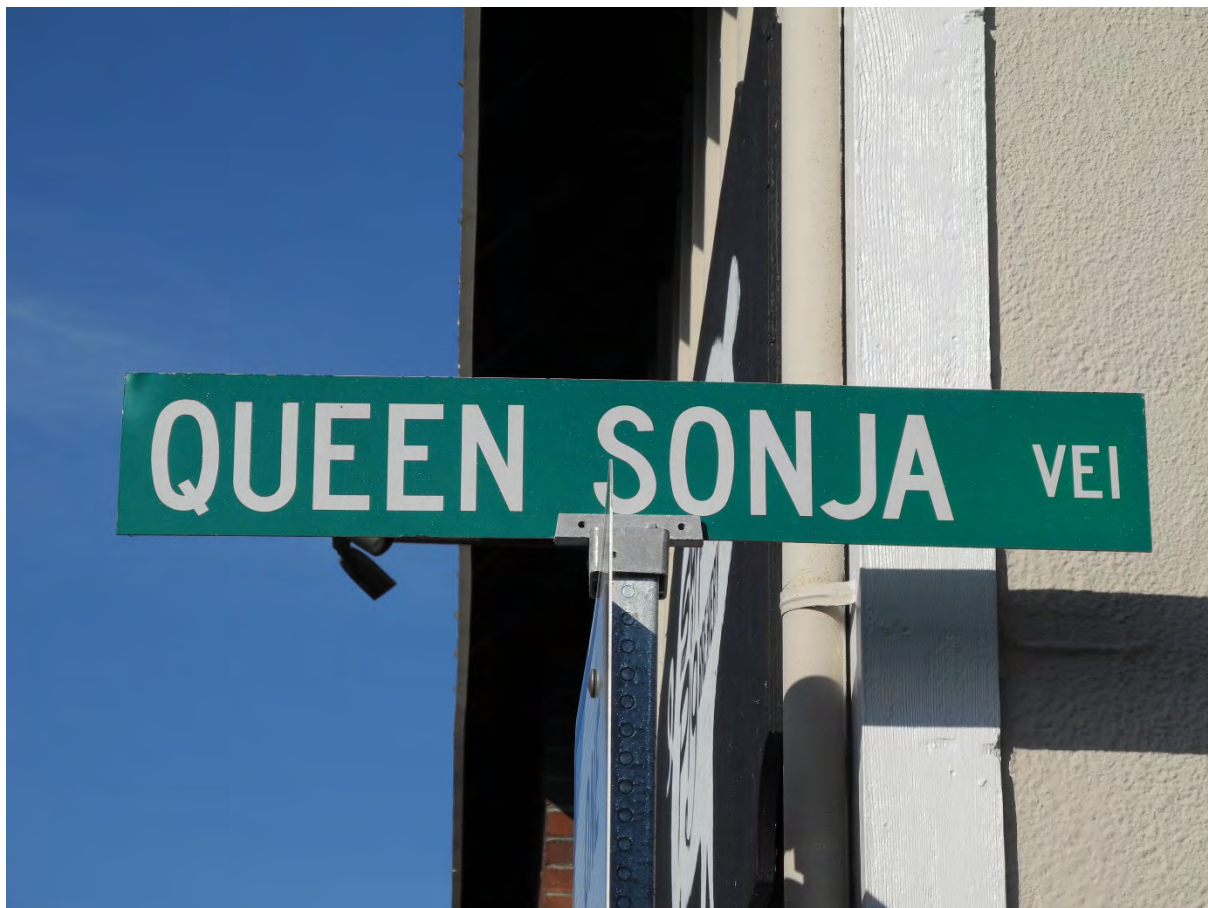
Gatenavn i Poulsbo ved Lodgen.