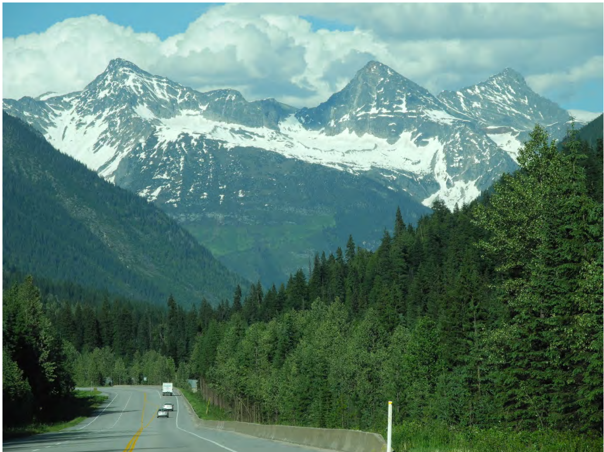
Rocky Mountains, Rogers Pass, British Columbia mot Golden.