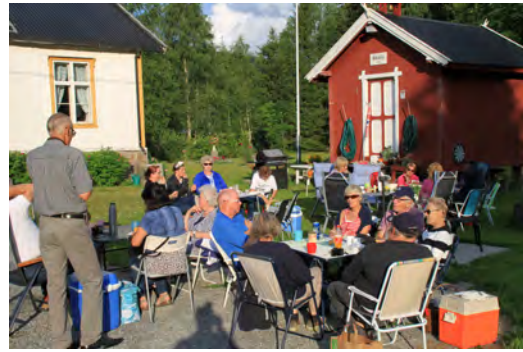
Glimt fra gril og auksjon i Hurdal i juli.