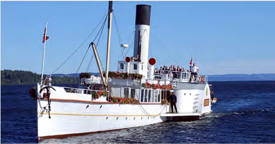
Skibladner

Søndag 14. juni inviterte Sons Of Norway, Eidsvold Lodge til «Smørbrødcruise» på Skibladner. Om det var datoen som var upassende for flere vites ikke, for her burde flere vært med. Uansett, vi var 9 medlemmer + 2 gjester som møtte opp på brygga i Eidsvoll litt før kl. 11. Været var nesten pent, men litt vind gjorde det litt surt. Vi ble tatt godt vare på av mannskapet. Noen satte seg i Damenes Salong, mens andre utfordret vinden og oppholdt seg på dekk. Etter en stund var det klart for å innta lunsjen i «Første Plads Madsalon». Nydelig dekket bord med hvite damaskduker som seg hør og bør på en slik stolt og ærverdig dame. De tradisjonelle rekesmørbrødene skuffet vel ingen, selv om noen i selskapet hadde gått for karbonadesmørbrød, også det meget velsmakende. Etter en hyggelig stund hvor praten gikk om løst og fast ble måltidet avsluttet med kaffe.