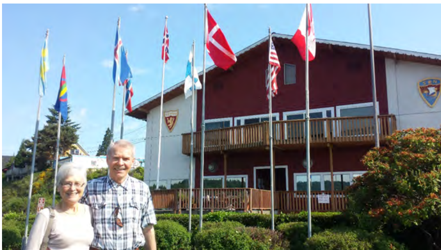
Her står vi foran lokalene til SofN Poulsbo Lodge 2-044 i Pulsbo, Washington.