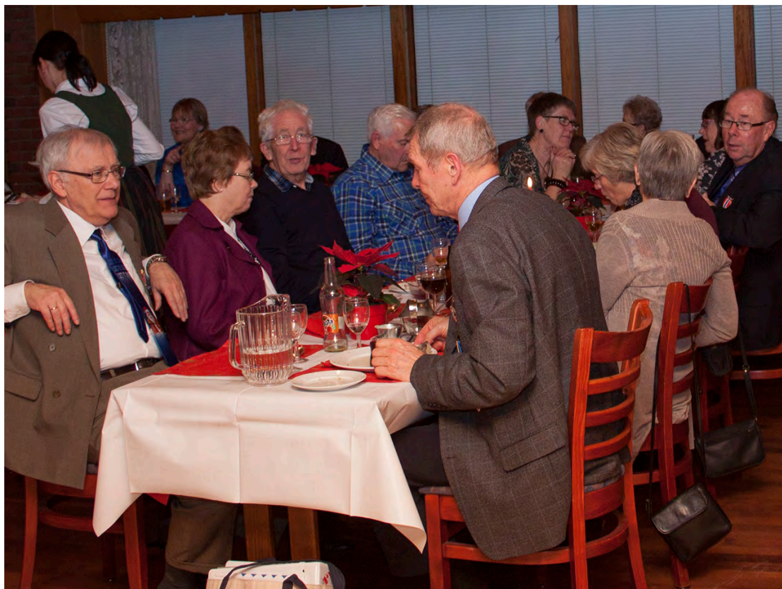
Og gjestene koste seg i flere kveldstimer mens gradestokken sank utendørs...