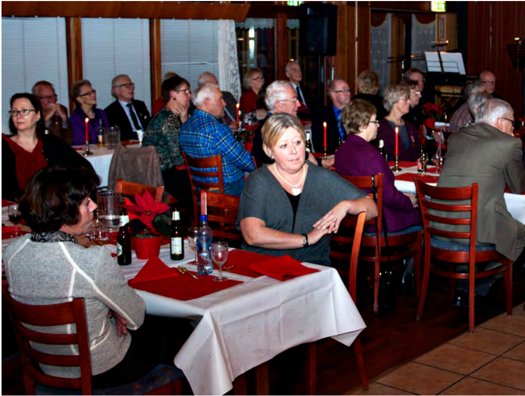
Mye folk på julebordet også denne gang.