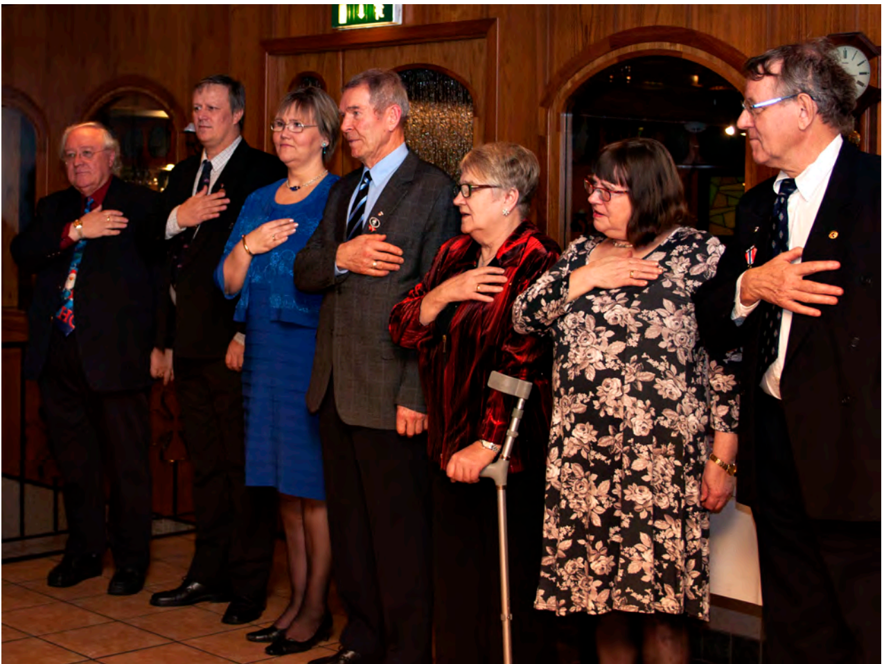
Høytidelig øyeblikk hver gang et nytt styre avlegger Sons of Norways tillitsløfte.