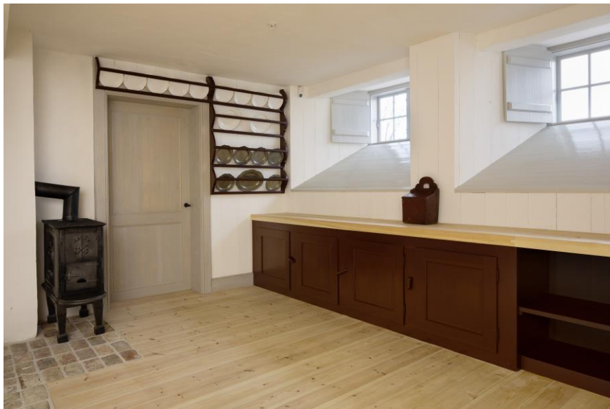
Del av kjøkkenet i bygningens kjeller, nå fullrestaurert og flott – det også.