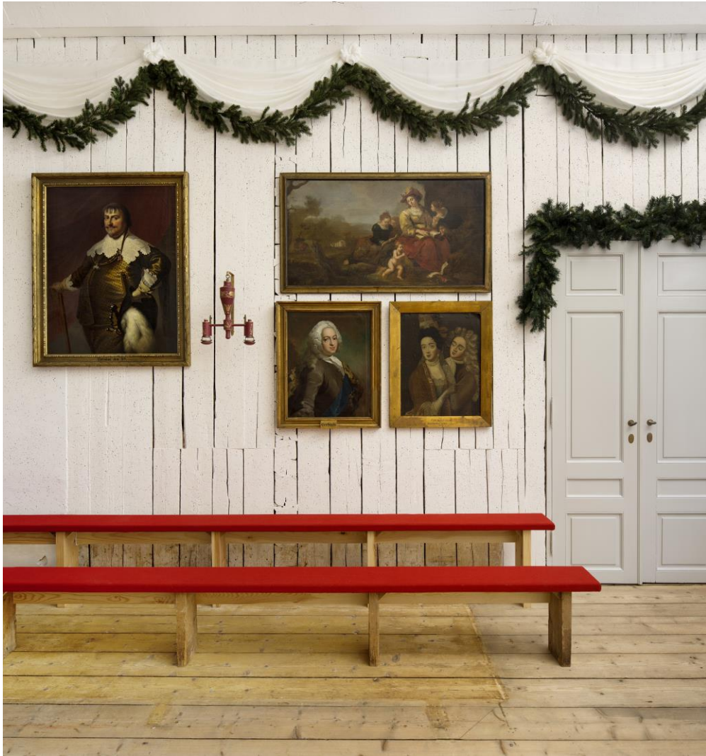
Detalj fra Rikssalen, om vegger kunne tale...